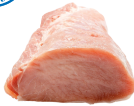
LOMO DE CERDO X500 gr PLU:4363