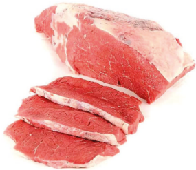
LOMO CARACHA X500 gr PLU:4310