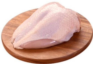
PECHUGA MAC POLLO CONGELADO X500 gr

PLU:5467 $ 3.990 Gramo a: $7,98 500 KG. DISP