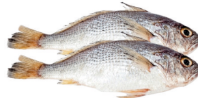
CAJERO X500 gr

PLU:17715 $ 3.850 Gramo a: $7,70 500 KG. DISP