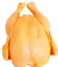
POLLO BUCANERO CAMPES. S/V REFRIG X500 gr

PLU:5489 $ 10.690 Gramo a: $21,38 500 KG. DISP