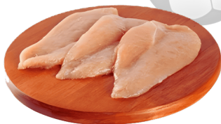
FILETE PECHUGA MAC POLLO REFRIG X500 gr

PLU:33829 $ 2.500 Gramo a: $5,00 500 KG. DISP