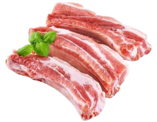
COSTILLA DE CERDO X500 gr PLU:4357