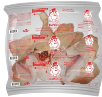
RECORTE DE POLLO CAMPOLLO MARINAD X500 gr

PLU:5467 $ 3.990 Gramo a: $7,98 500 KG. DISP