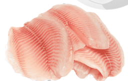
FILETE DE TILAPIA X500 gr

PLU:10693 $ 3.980 Gramo a: $7,96 500 KG. DISP